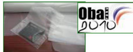
Permanentně antistatické fólie