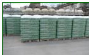
Stretch hood FLEXOTEN®