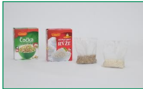
Fólie pro varné sáčky PERFOTEN®