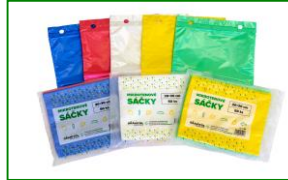
Mikrotenové sáčky GRANITOL