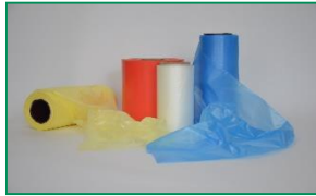
HDPE fólie MIKROTEN®