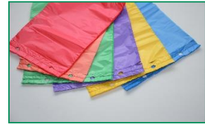
Sáčky, košílky, přířezy