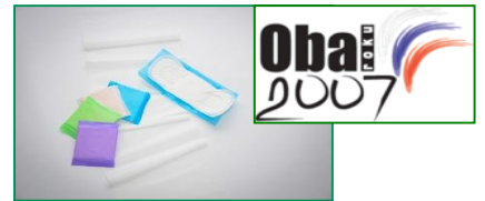
Fólie pro osobní hygienu HYGITEN®