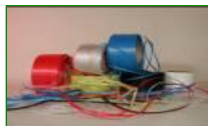
Polypropylenové vázací pásky GRANOFLEX®