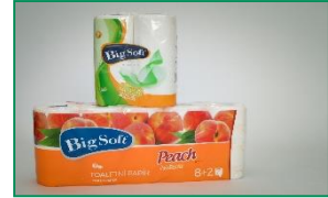
Obalové fólie GRANOTEN®