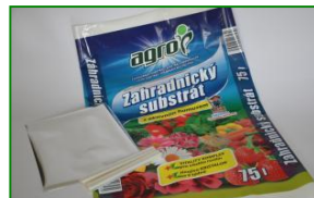
Laminované fólie LAMITEN®