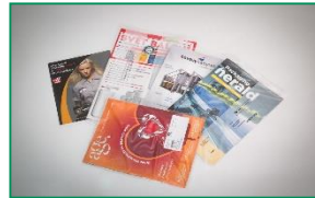
Fólie s PP GRANOPEN®