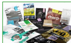
Laminované pytle na PetFood LAMIBAG®