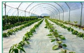
Technické fólie SEPATEN®, plachty